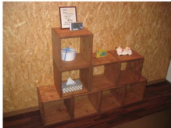
組み換え自由な木製ボックス